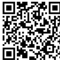
<モバイルコロムビアフル>