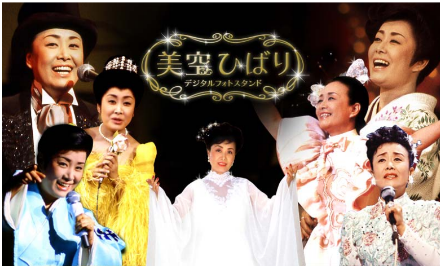
<美空ひばり デジタルフォトスタンド イメージ>

本商品は、生産時に美空ひばりの写真100枚と、当社から発売された“愛燦燦”、“川の流れるように”、“東京キッド”の定番楽曲から、“スターダスト”、“ペイパー・ムーン”などのジャズまで幅広い音源20曲、そして武道館のライブ映像3曲を収録しております。アーティストのオリジナル楽曲やライブ映像が収録されたデジタルフォトフレームは史上初となります。