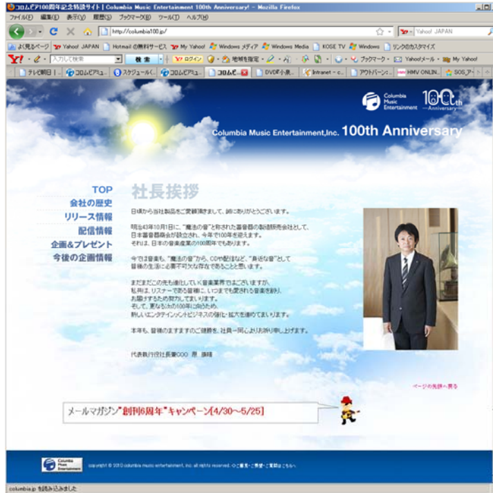
<100周年記念特設サイト:挨拶ページ>

記念作品、配信情報、企画、プレゼント情報など、100周年関連の最新情報を提供しております。