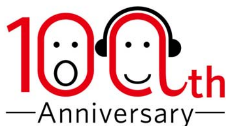
(100周年記念ロゴマーク)

“音楽を楽しく聴く人”、“音楽を楽しく口ずさむ人”をイメージし、レコード会社らしいデザインといたしました。この記念ロゴマークは、2010年1月1日から2011年9月30日まで、自社制作作品、販促ポスター、イベント、会社封筒、紙袋等に適時使用していきます。