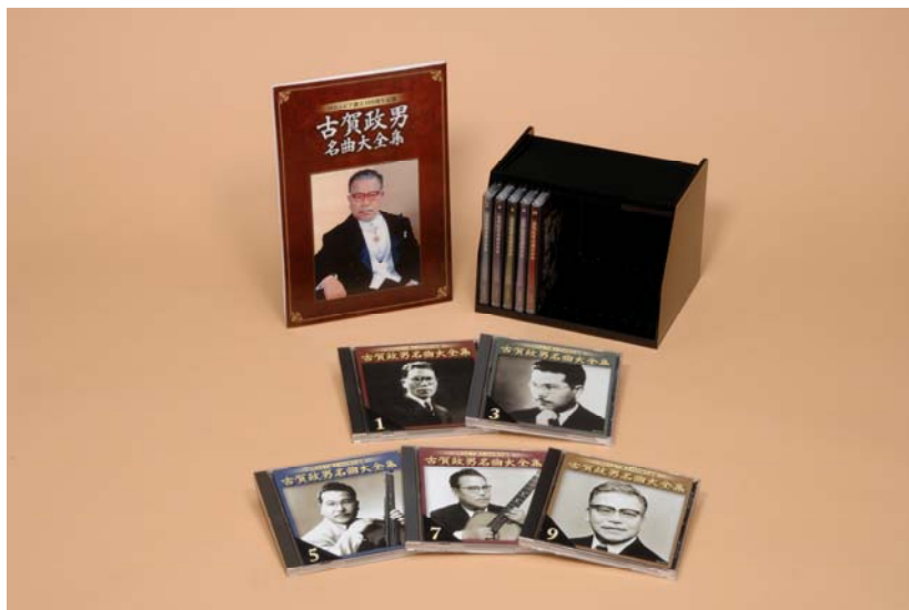
<古賀政男名曲大全集>

CD10枚組 ¥21,000(税込) http://shop.columbia.jp/shop/picup/kogamasao.aspx