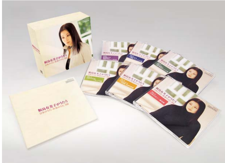
< 鮫島有美子 100 周年記念作品 >