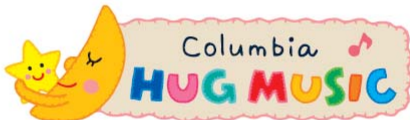
< 赤ちゃんレーベル“HUG MUSIC”ロゴ >

第1弾作品のリリースは、2010年10月1日を予定しております。 詳細につきましては、後日改めて発表いたします。