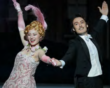
プロデュースオペラ2021喜歌劇『メリー・ウイドウ』 (初日公演：2021年7月16日)より