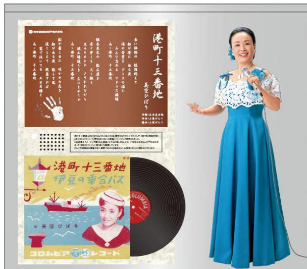
港町十三番地歌碑