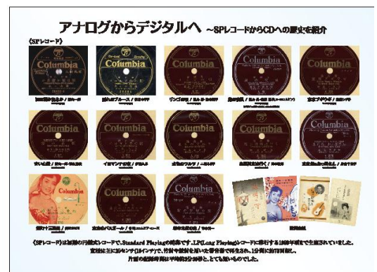
レコードの歴史紹介パネルイメージ