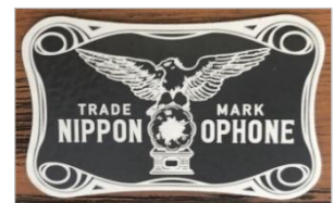
SP盤風レコードやアーム、ロゴ等細部に「ニッポノホン35号」を思い出させるディテールにこだわりました

「インテリア蓄音器」は、持ち運びやすい大きさで場所を選ばず電源不要で操作が簡単なスマートフォンスピーカーとしてもお楽しみいただけます。スマートフォンの音がメガホンと同様の効果で増幅される構造になっており、スマートフォンの画面を観ながら、スマートフォン単体で聴くよりも心地よいラッパ型蓄音器のような味わいのある音に聴こえます。録音・録画した音や映像を繰り返し視聴しながらのお稽古等にもぜひご活用ください。使用方法や特長等は、日本コロムビア「インテリア蓄音器」ホームページで紹介しています。