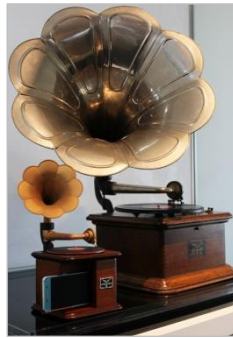
「インテリア蓄音器」(手前)と、「ニッポノホン35号」